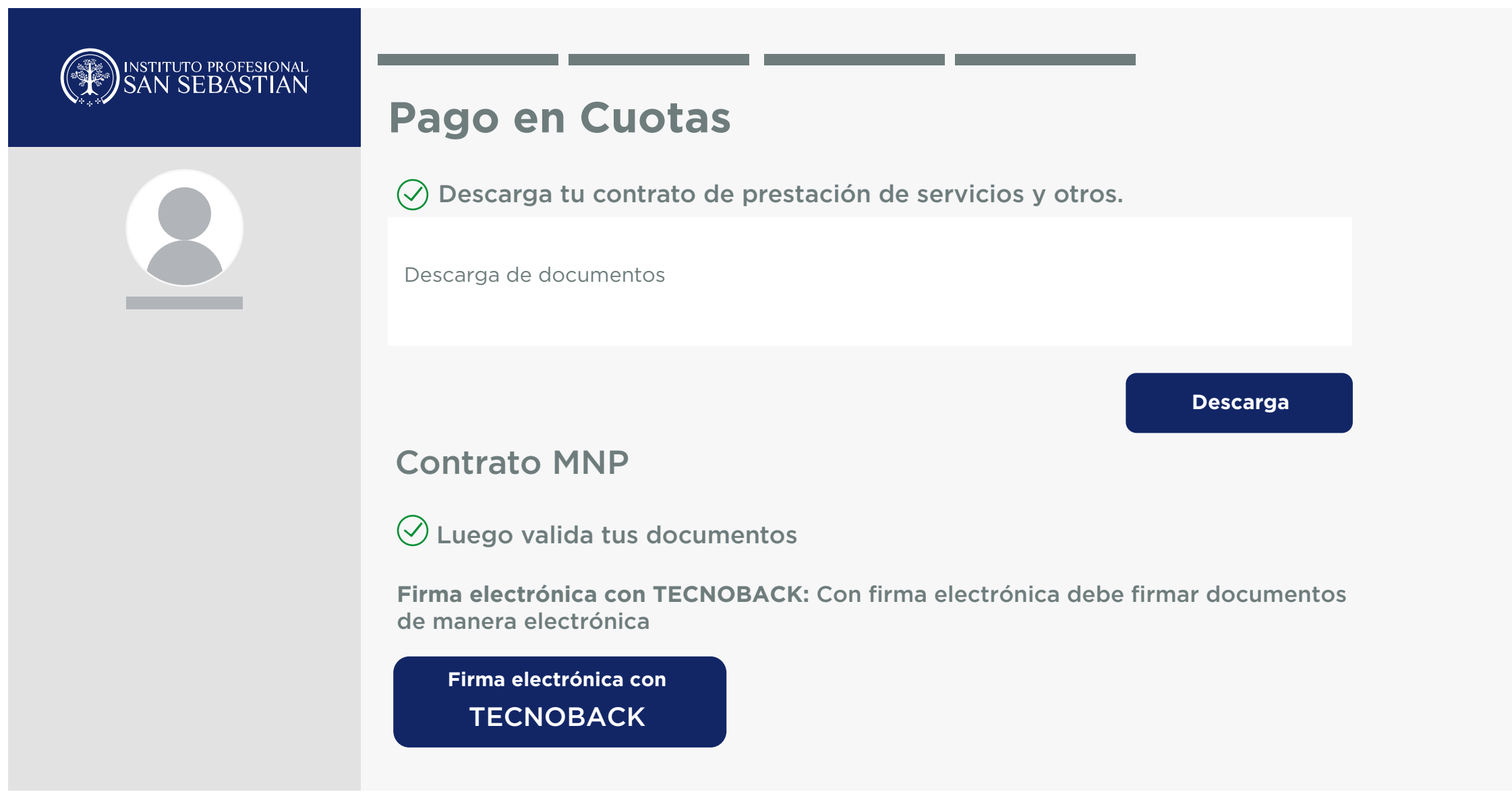
Fig 3: Antes de firmar, podrás visualizar y descargar tu contrato.

Una vez pagada la matrícula, debes completar la firma digital del contrato , tanto tú como tu codeudor solidario (si corresponde).