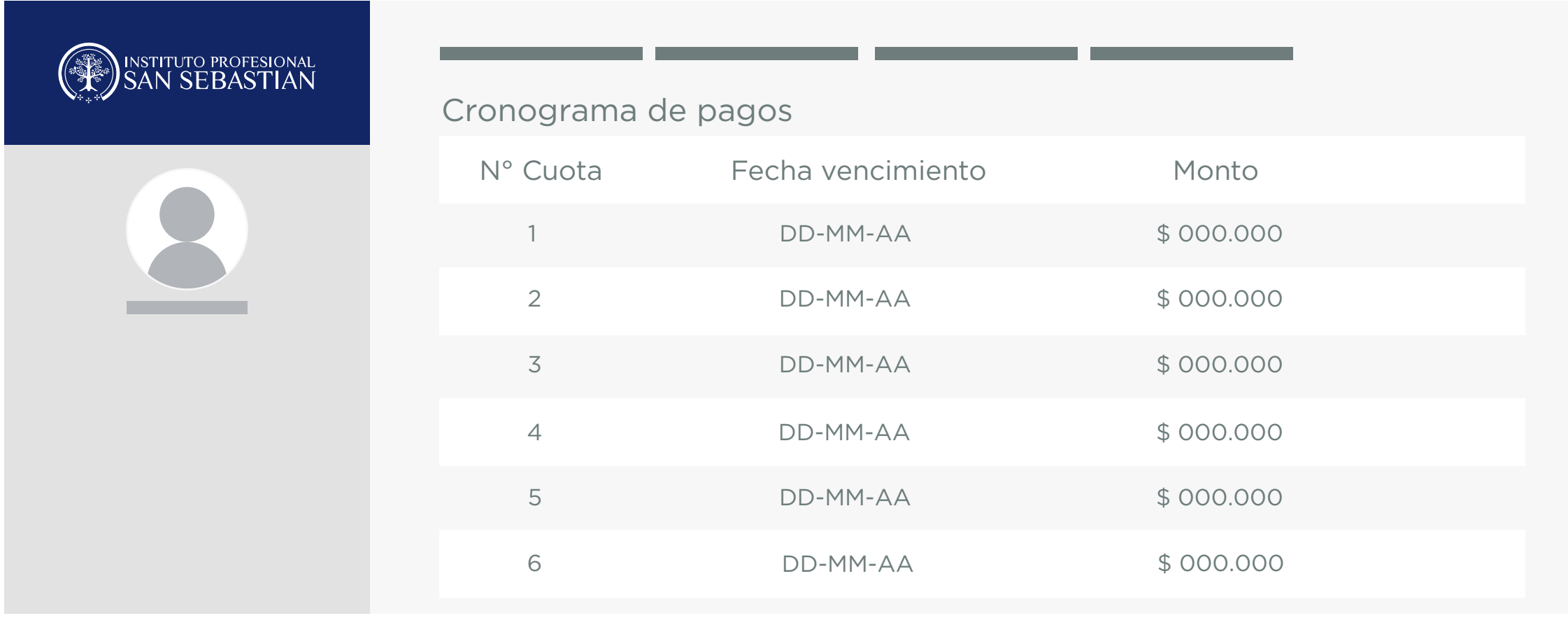
Fig 2: El sistema mostrará número de cuotas, fecha de vencimiento y monto pactado de cada una.

Una vez pagada la matrícula, debes completar la firma digital del contrato , tanto tú como tu codeudor solidario (si corresponde).