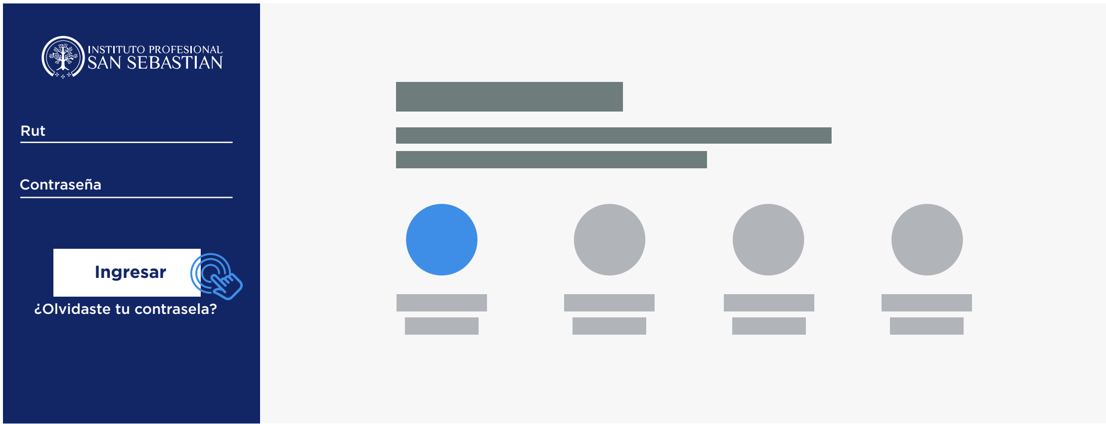
Fig 1: Si no recuerdas tu contraseña, recupérala haciendo clic en “¿Olvidaste tu contraseña?”.

Accede con tu RUT con dígito verificador (sin puntos ni guion) y tu contraseña en: https://umas.ipss.cl/matriculaantiguos